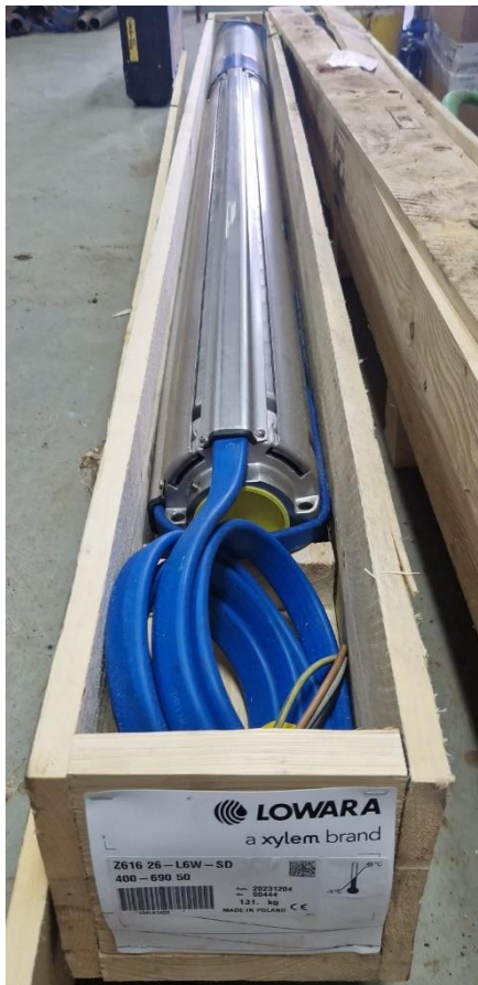
LOWARA Z616 26-LW SD