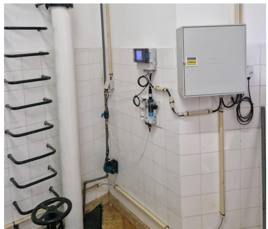
Medidor de cloro em linha