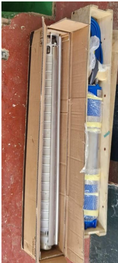
LOWARA Z616 18-6