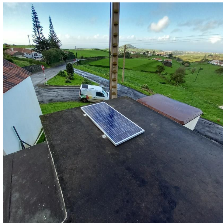
Sistema de telemetria e telegestão e painel fotovoltaico instalado no lugar do Bom Despacho, Almagreira