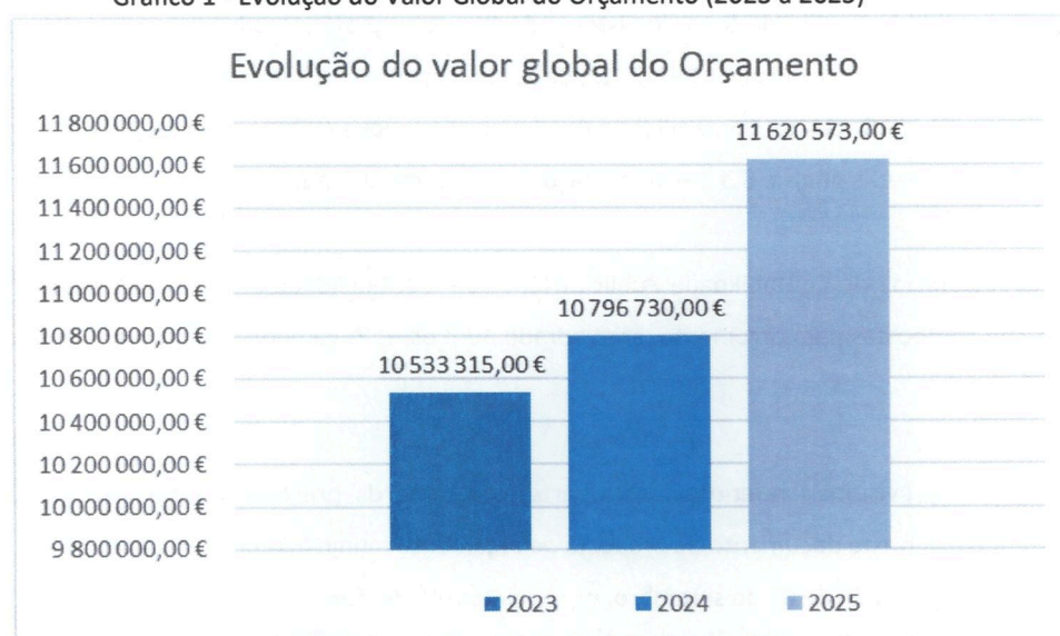
Gráfico 1 - Evolução do Valor Global do Orçamento (2023 a 2025)

A previsão orçamental para 2025, por agrupamento da classificação económica é a seguinte: